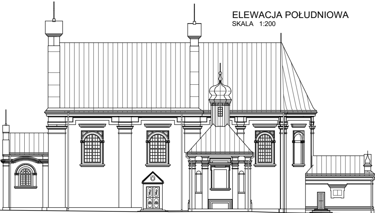
ELEWACJA POŁUDNIOWA SKALA 1:200