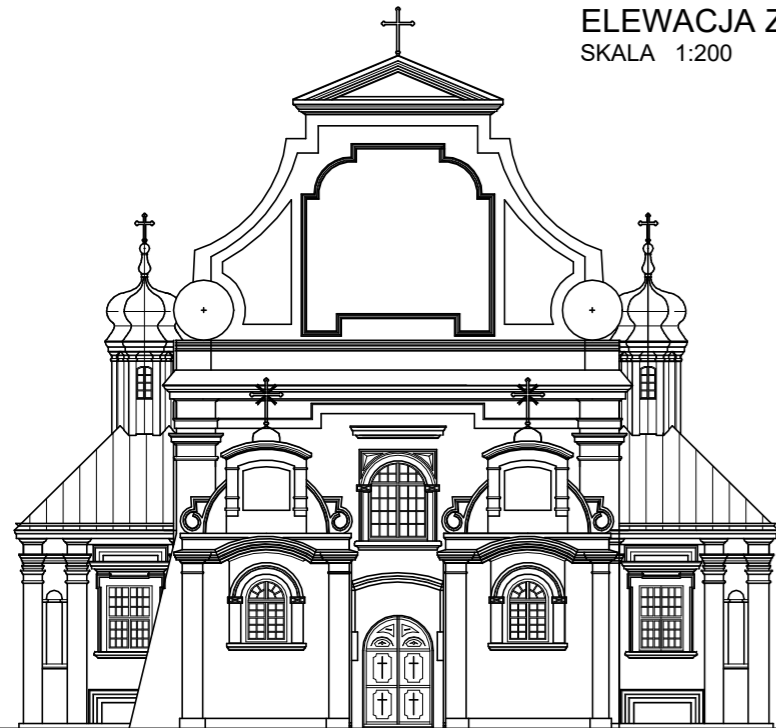
ELEWACJA ZACHODNIA SKALA 1:200