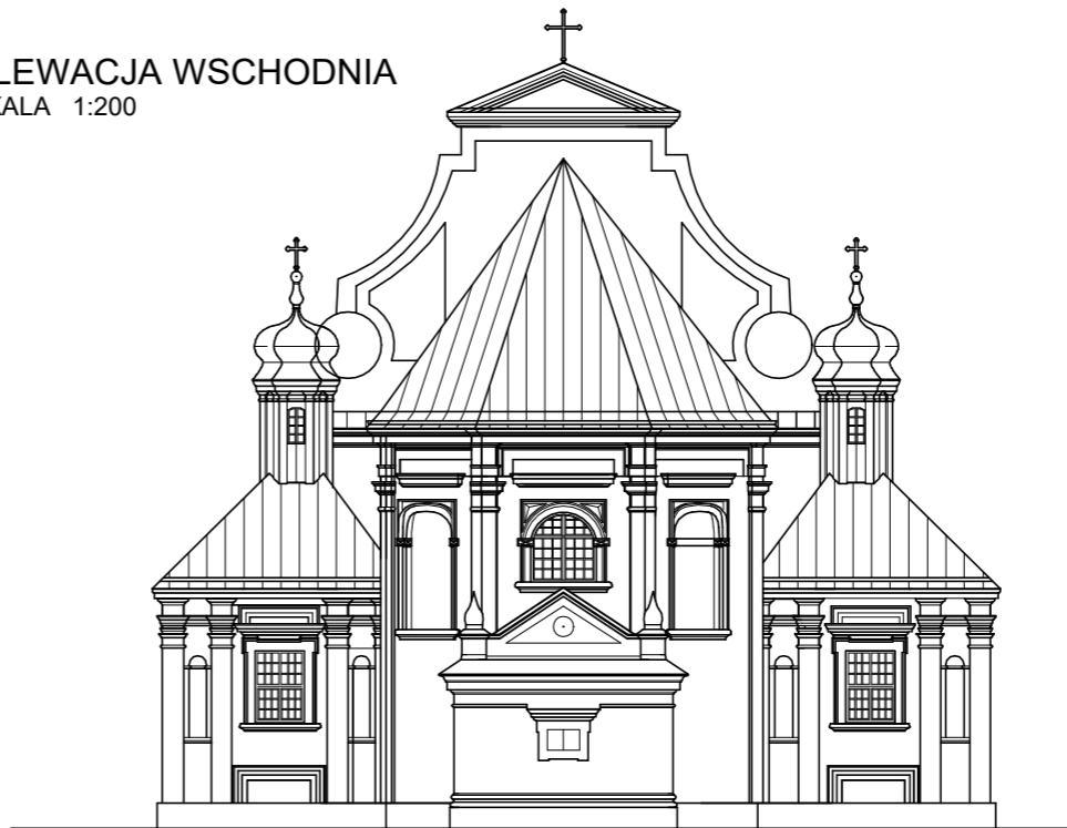
ELEWACJA WSCHODNIA SKALA 1:200