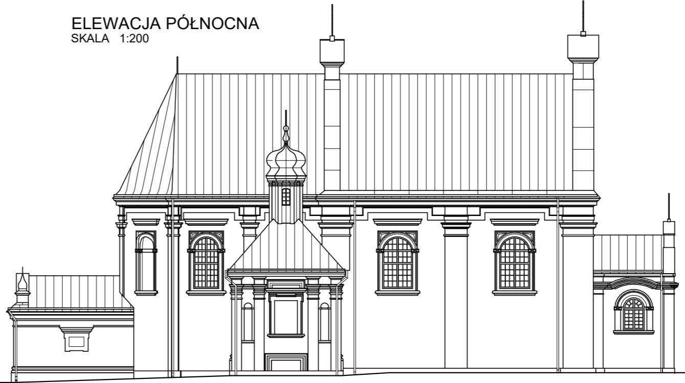
ELEWACJA PÓŁNOCNA SKALA 1:200